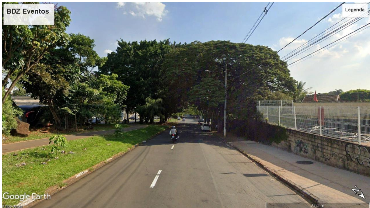
>> Via COLETORA, Av. Prof. Atilio Martini, sentido Av.

RELATÓRIO FOTOGRÁFICO (TAMANHO E RESOLUÇÃO ADEQUADA QUE PERMITA SEU ENTENDIMENTO):