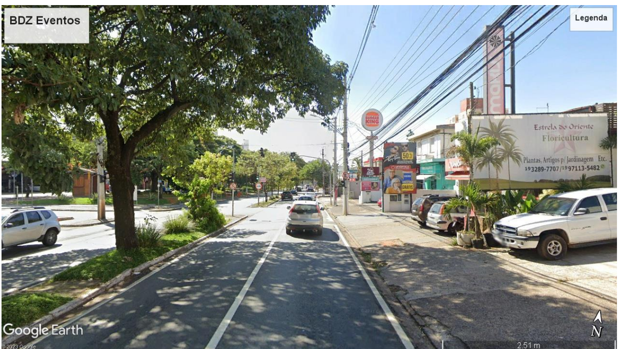
>> Via ARTERIAL, Av. Albino J. B. de Oliveira, sentido Br. Geraldo