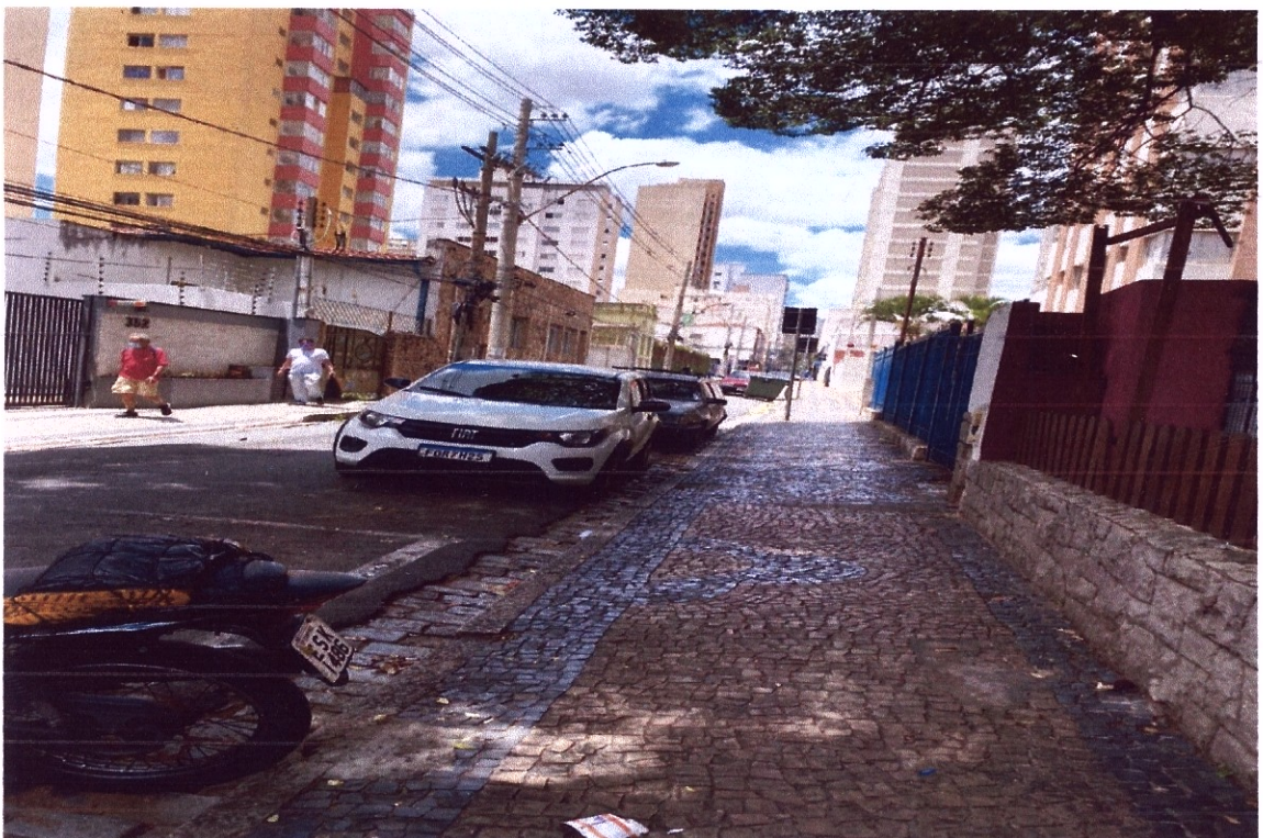
Lateral direita do estabelecimento