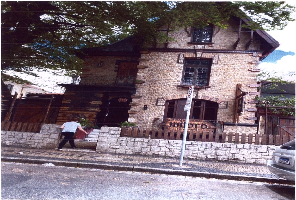
FACHADA DO ESTABELECIMENTO