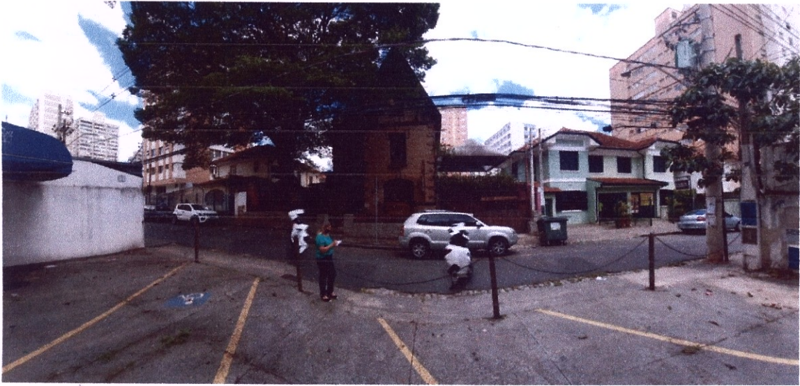
Frente do estabelecimento com vista para a Rua Sacramento