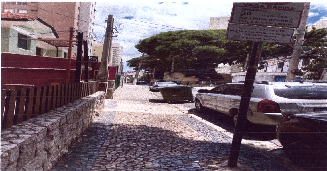
Lateral do estabelecimento com vista para a Rua Sacramento