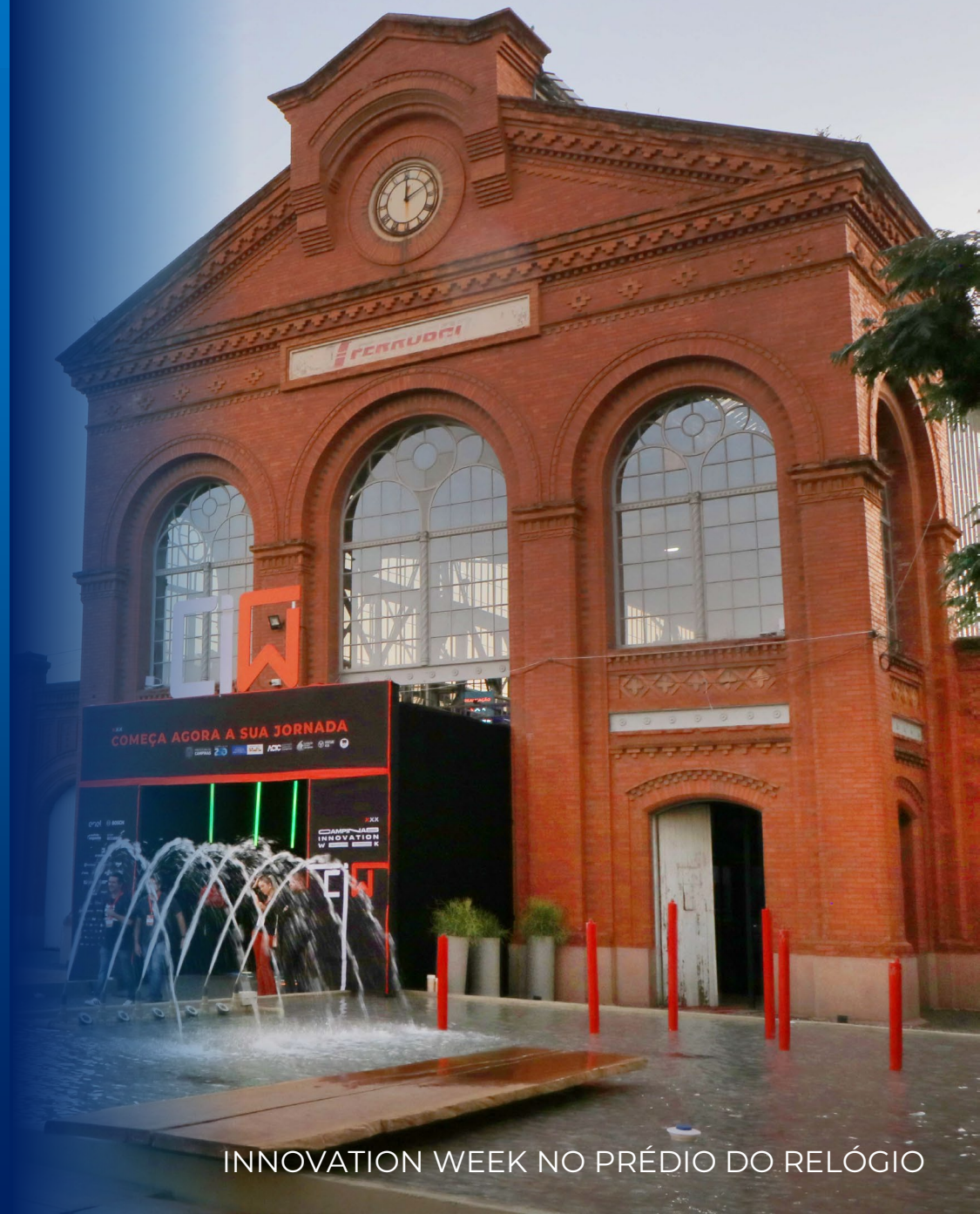
INNOVATION WEEK NO PRÉDIO DO RELÓGIO