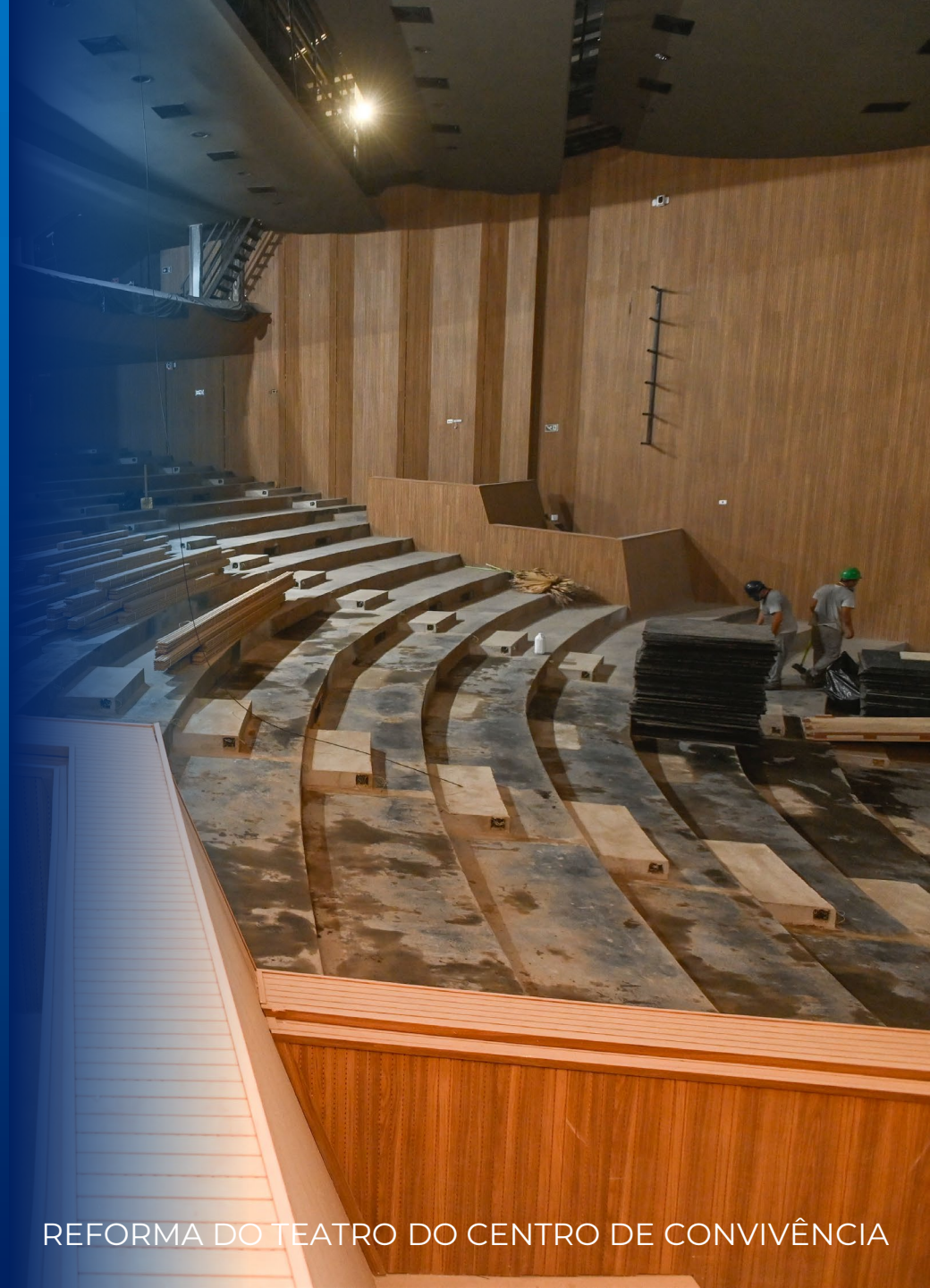
REFORMA DO TEATRO DO CENTRO DE CONVIVÊNCIA