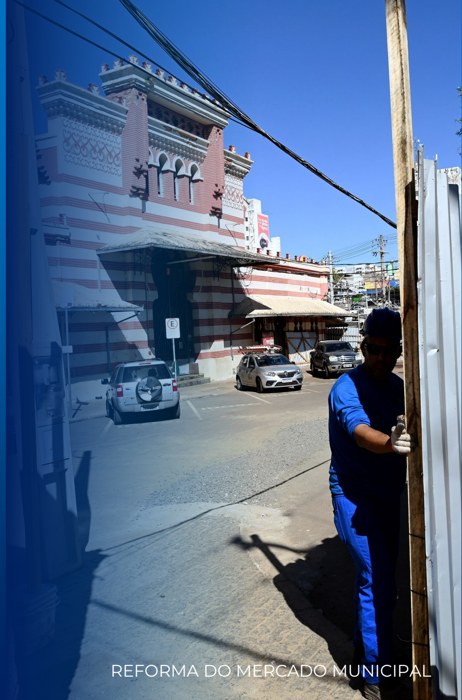
REFORMA DO MERCADO MUNICIPAL