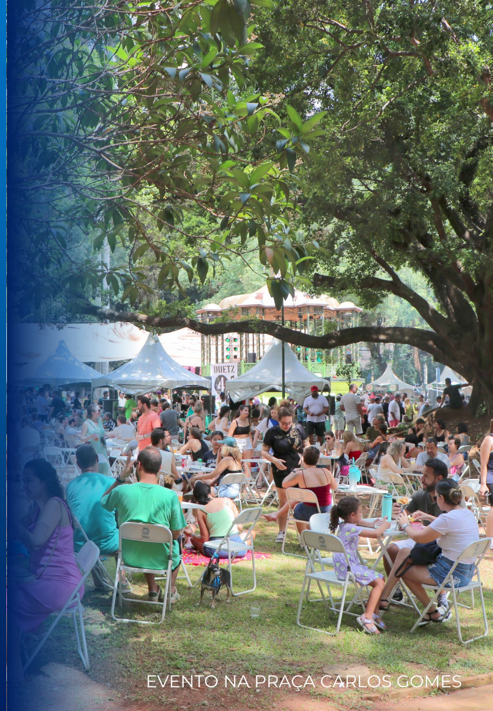
EVENTO NA PRAÇA CARLOS GOMES