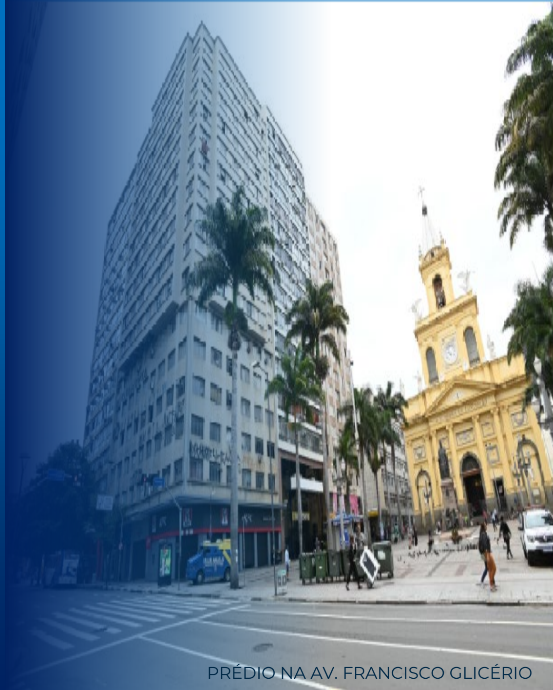
PRÉDIO NA AV. FRANCISCO GLICÉRIO