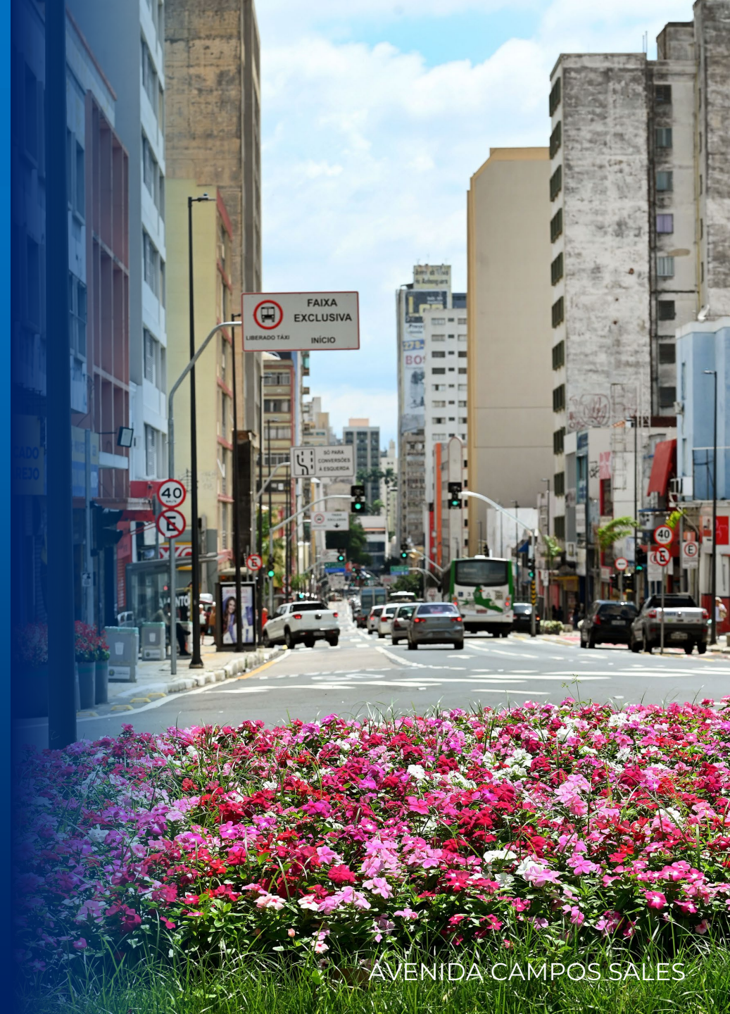
AVENIDA CAMPOS SALES