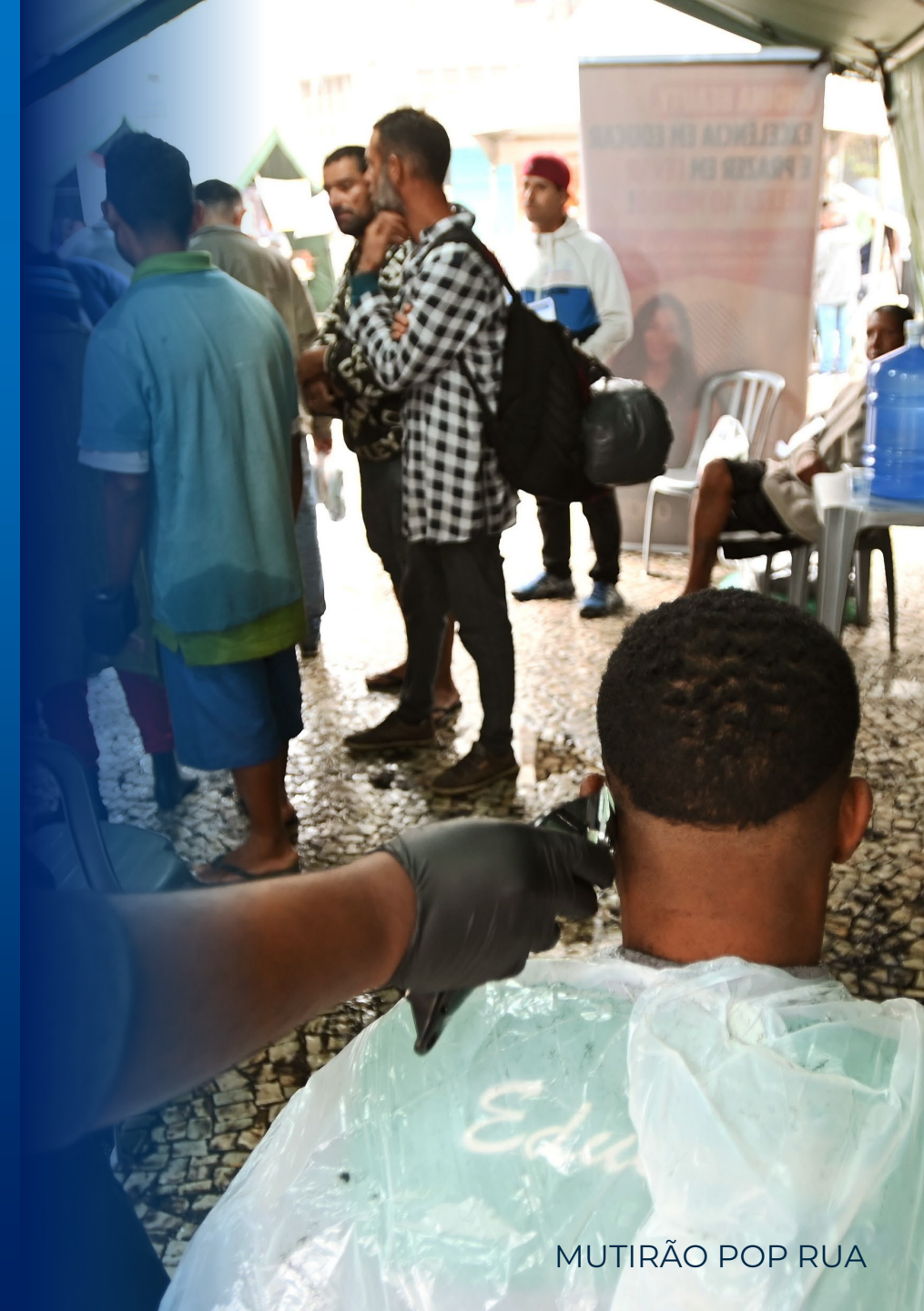
MUTIRÃO POP RUA