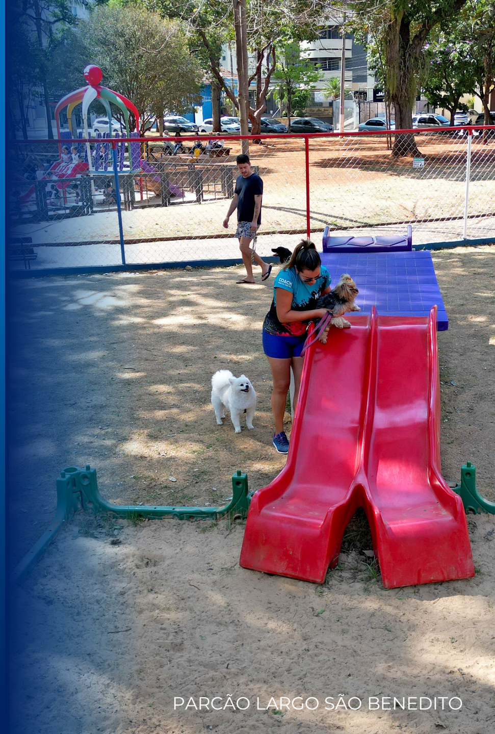
PARCÃO LARGO SÃO BENEDITO