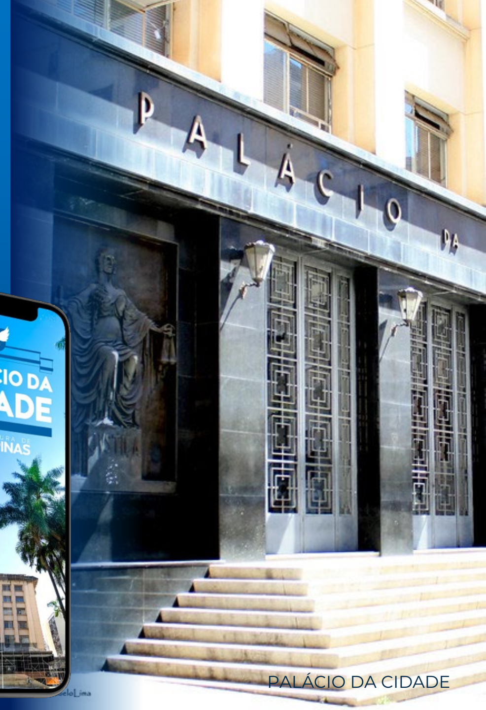
PALÁCIO DA CIDADE