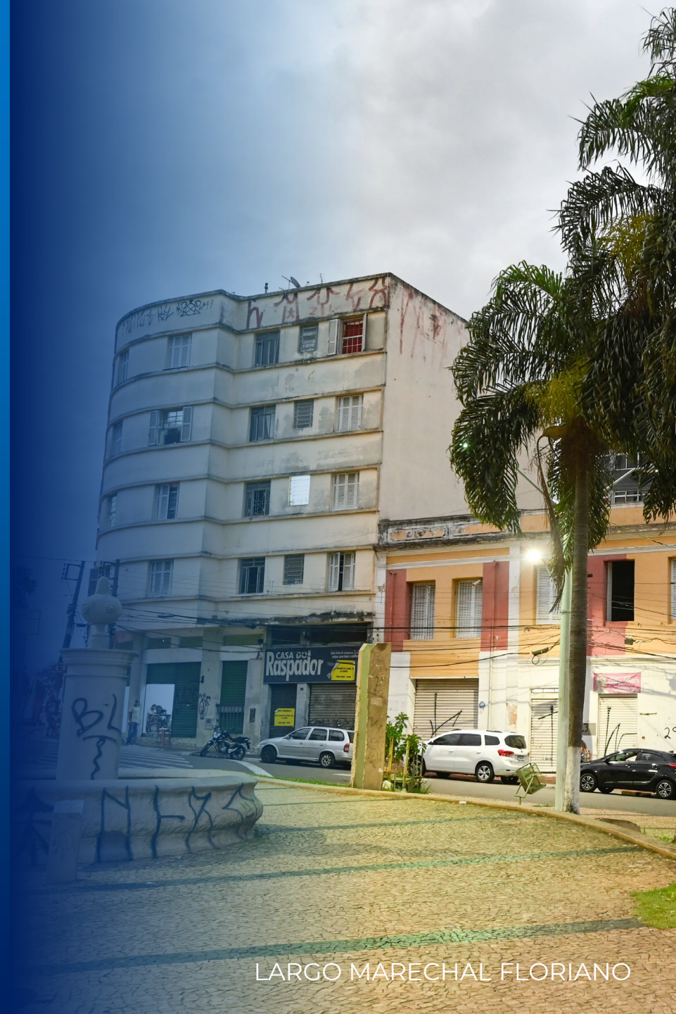
LARGO MARECHAL FLORIANO