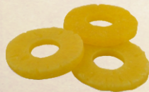
Processado: em calda