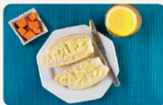
Café da Manhã