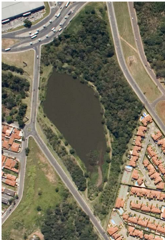
Imagem 4: Vista do trecho (1C) do Parque Linear do Ribeirão das Pedras, e da lagoa de controle de cheias implantada. Observa-se a recuperação da mata ciliar de proteção ao recurso hídrico, conformando o “piscinão” ecológico.