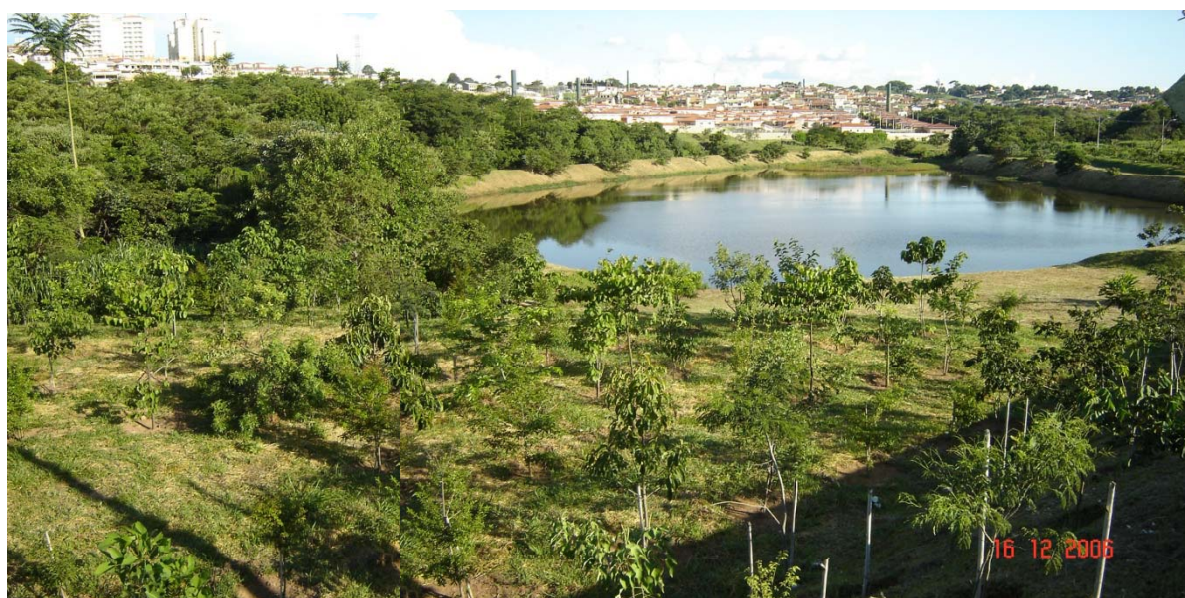
Foto 20: Vista geral da lagoa ecológica de controle de cheias, que tem capacidade para armazenamento temporário de cerca de 70.000.000 de litros de água. Observa-se a densa vegetação ciliar implantada, criando condições para a atratividade da avifauna, incluindo espécies migratórias.

Imagem 4: Vista do trecho (1C) do Parque Linear do Ribeirão das Pedras, e da lagoa de controle de cheias implantada. Observa-se a recuperação da mata ciliar de proteção ao recurso hídrico, conformando o “piscinão” ecológico.