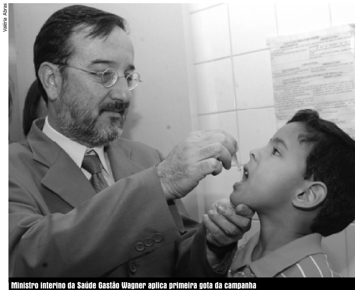
Ministro interino da Saúde Gastão Wagner aplica primeira gota da campanha

O lançamento nacional da segunda etapa da campanha foi feito em Campinas, no Centro de Saúde São Marcos, pelo ministro interino da Saúde, Gastão Wagner de