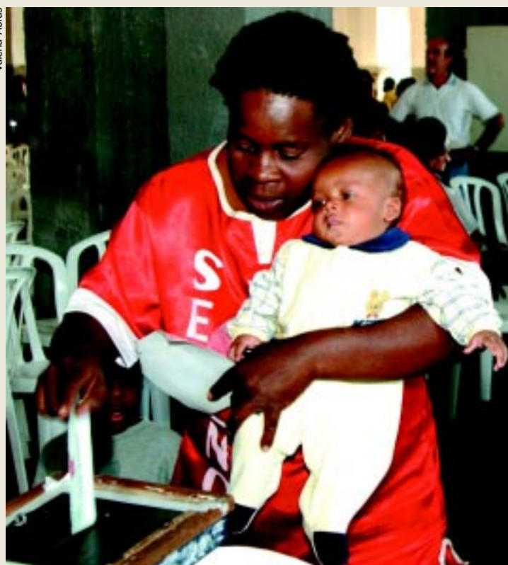
Mulher com filho no colo vota na Conferência da Cidade