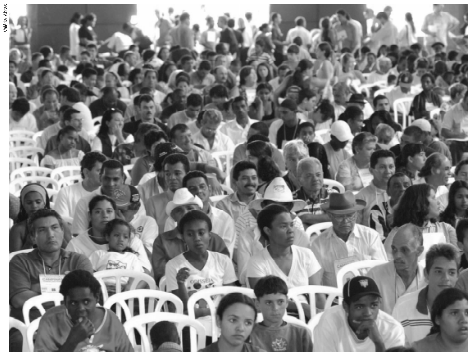
Dezenas de emendas ao texto base foram apresentadas pelos participantes da Conferência da Cidade

O período da manhã foi destinado à discussão do texto base proposto pelo Ministério das Cidades para ser discutido com a sociedade brasileira. O documento contém 100 itens que são norteadores das