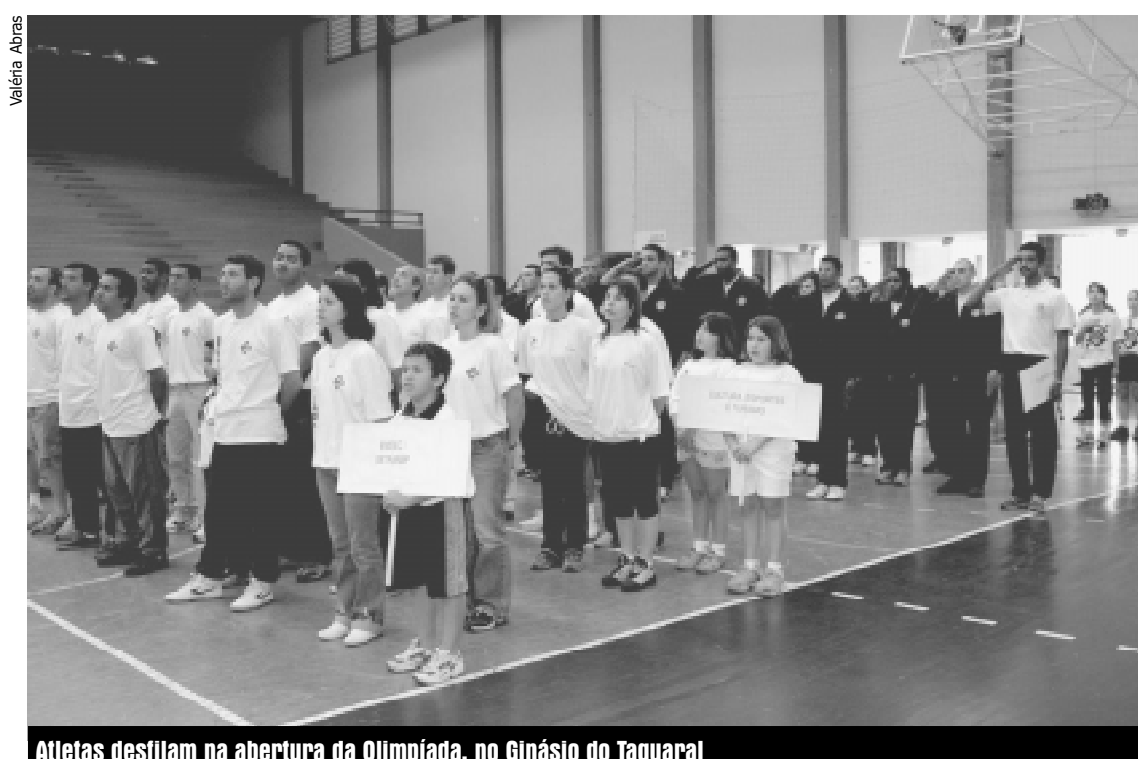
Atletas desfilam na abertura da Olimpíada, no Ginásio do Taquaral

Atletas de ponta também participam da 2ª Olimpíada do Servidor, como o