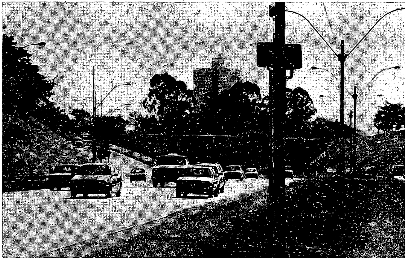
Campinas terá até o final do próximo ano um total de 100 radares instalados

Já os detectores acoplados aos semáforos funcionarão nos 60