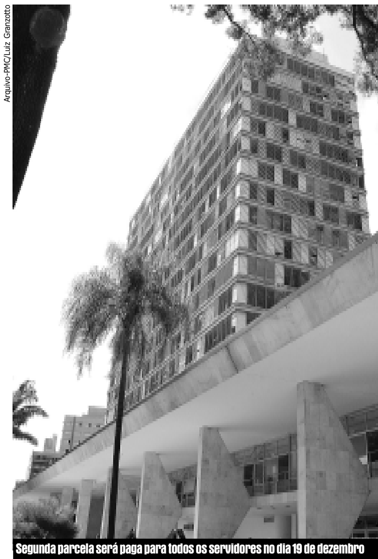
Segunda parcela será paga para todos os servidores no dia 19 de dezembro

Em 2002, o pagamento da segunda parcela do 13º salário foi antecipada em quase dez dias. O depósito foi feito no dia 12 e beneficiou mais de 20 mil servidoras e servidores municipais.