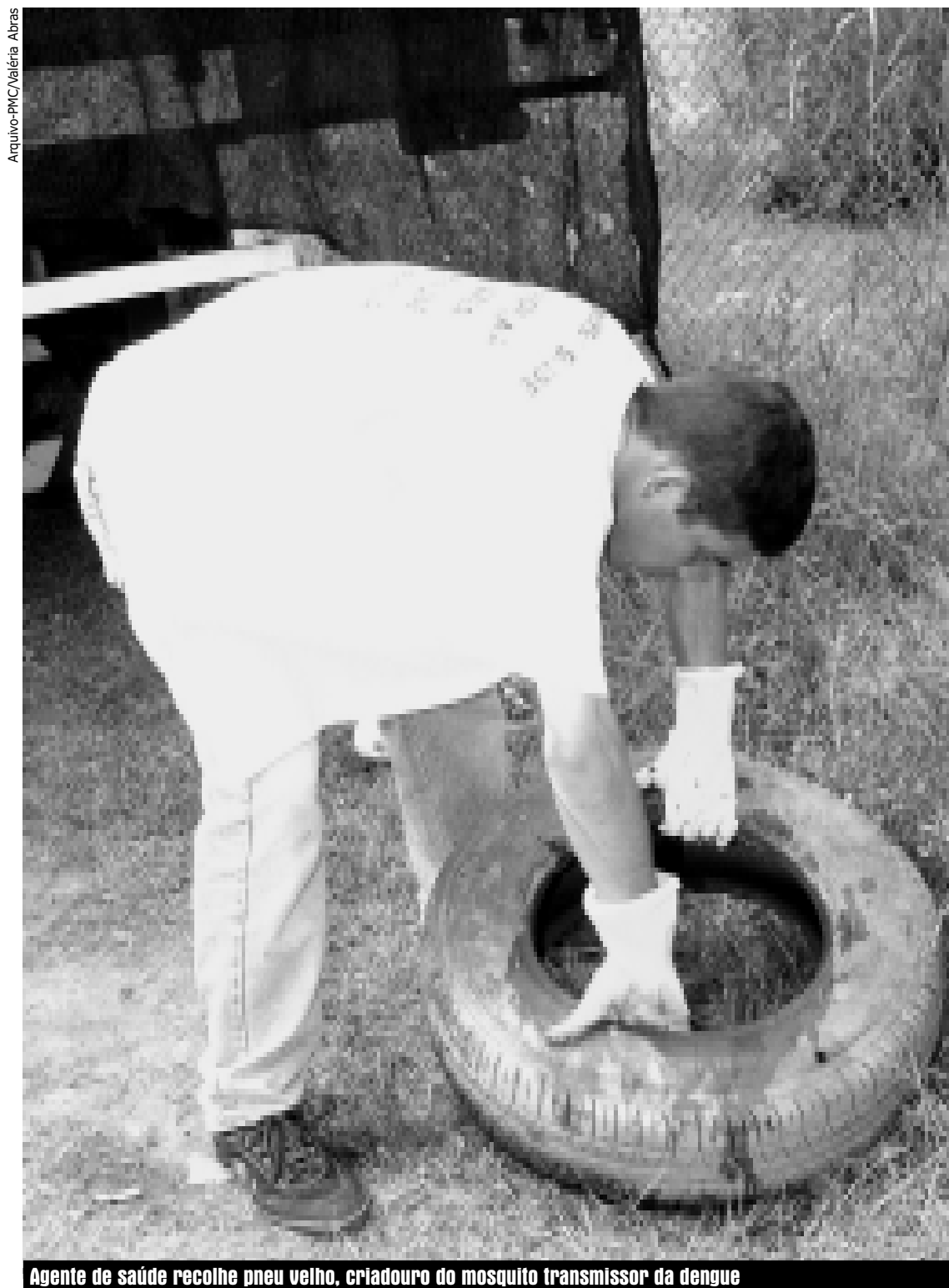
Agente de saúde recolhe pneu velho, criadouro do mosquito transmissor da dengue