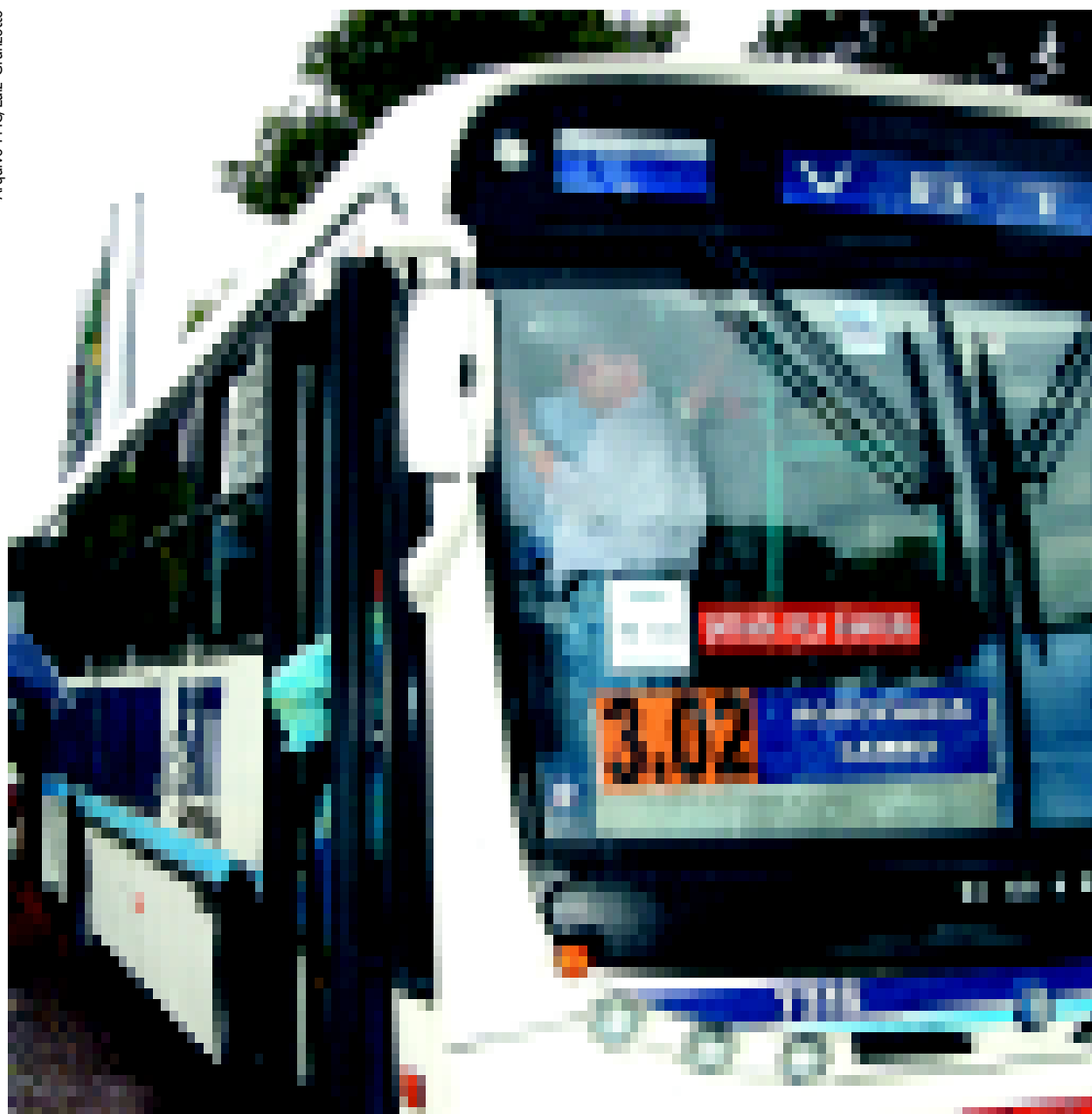
Entrada pela frente: redução no número de atropelamentos de passageiros após o desembarque