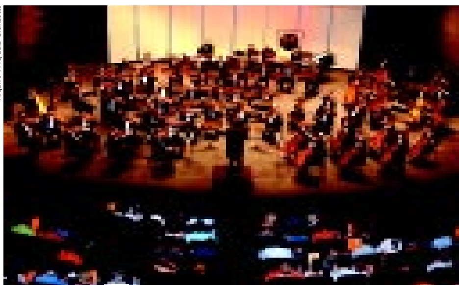
Cruz (acima) e a Sinfônica: Strauss, Ravel e Schumann no programa