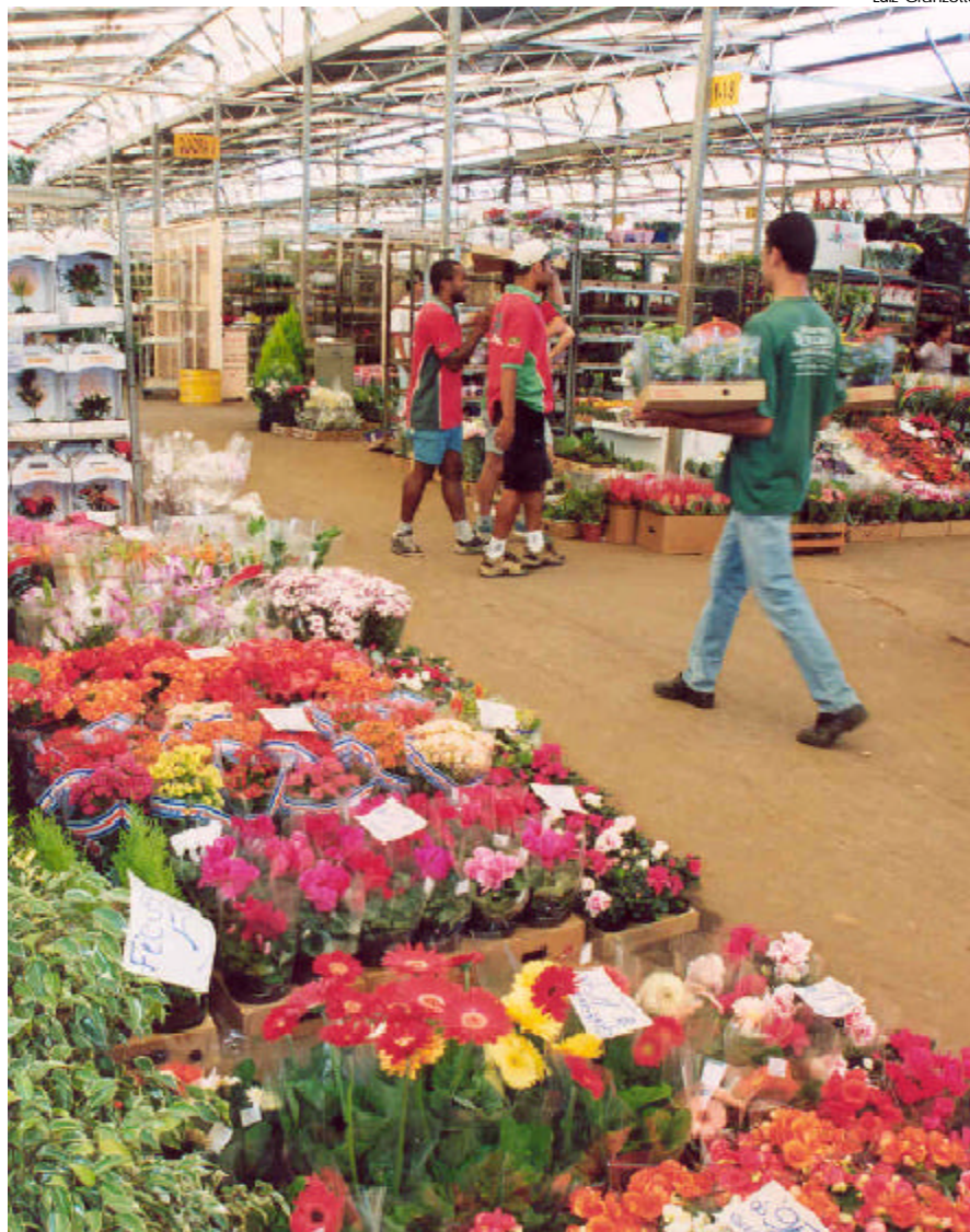
Mercado de Flores da Ceasa: mais segurança para permissionários e consumidores

Além disso, as três entidades estão estudando e implementando um Plano de Segurança. Algumas medidas de curto prazo já foram tomadas como a disponibilidade de um ramal, o 1190, para emergências de segurança; treinamento dos seguranças; recadastramento de todos os funcionários e permissionários; e a obrigatoriedade de uso dos crachás, entre outras.