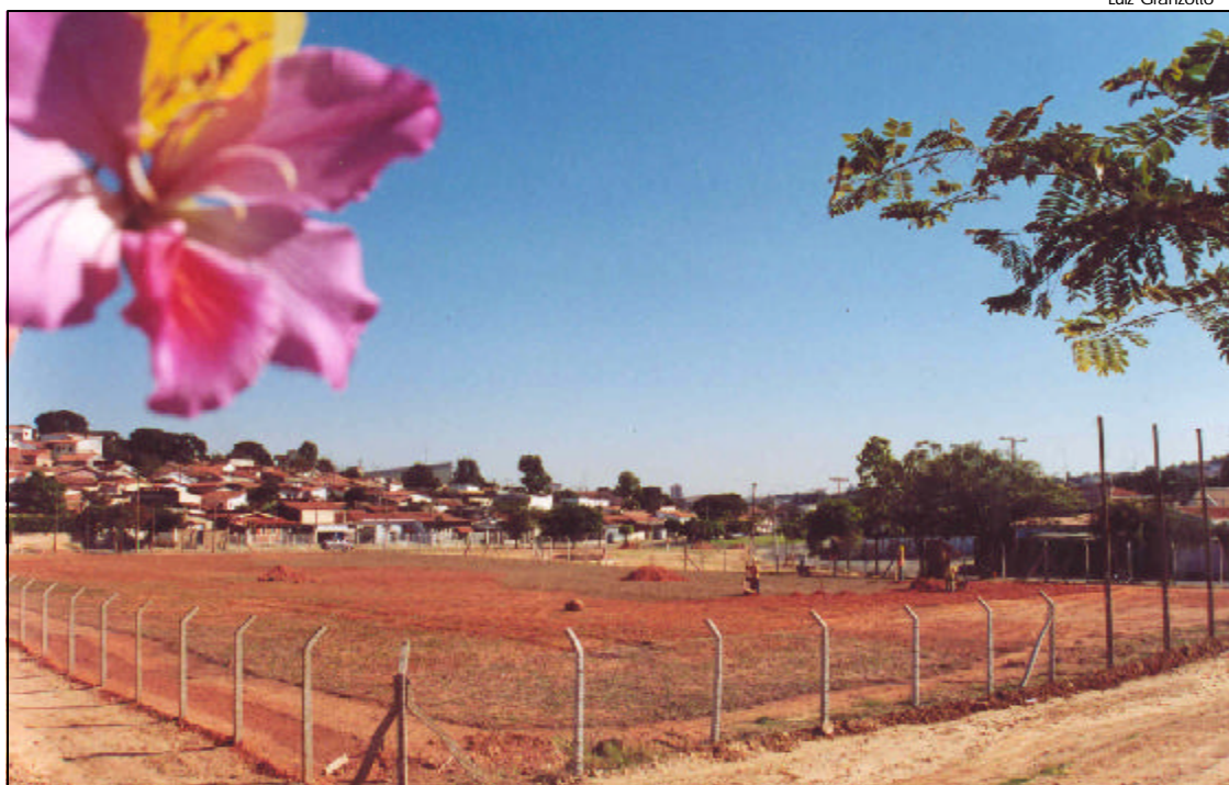
Vista parcial da área que será entregue neste sábado: 30 mil m 2 para lazer na Vila Georgina