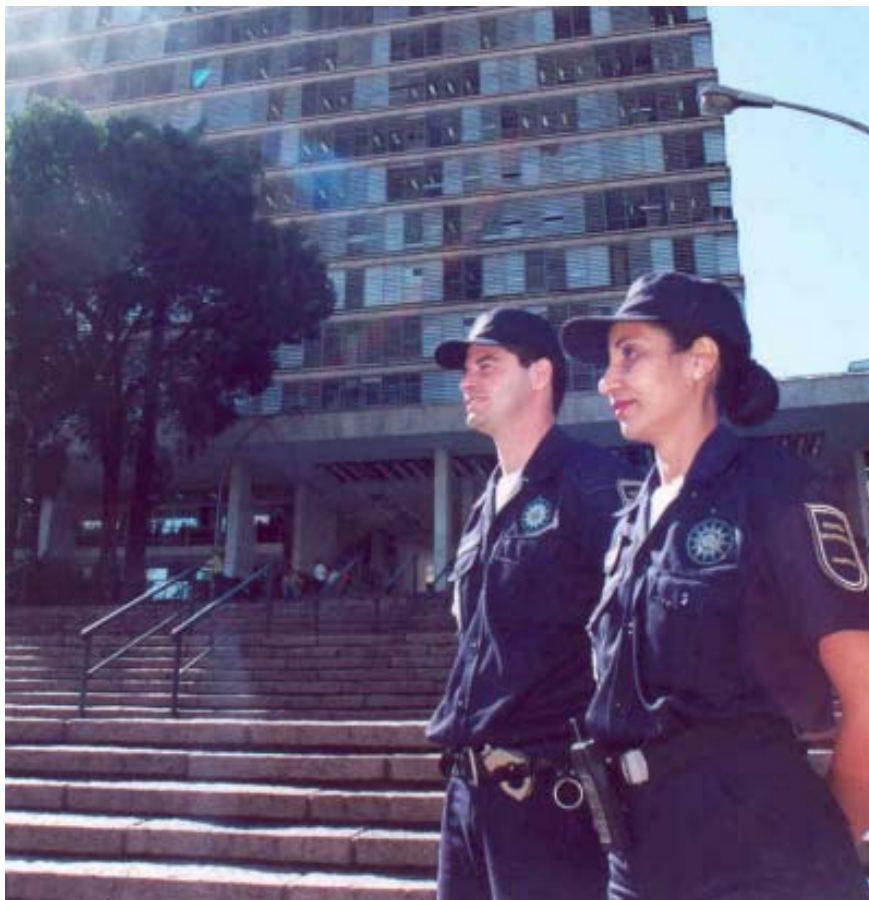
Guardas Municipais: preparo físico, direitos humanos e ética no histórico de formação

“Procuramos mostrar que damos atenção tanto para o preparo físico e as