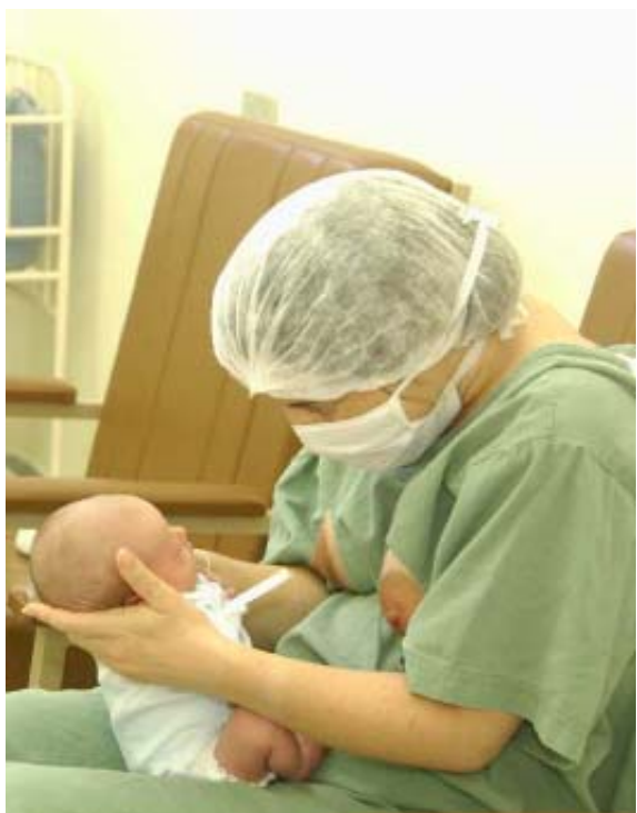
Leite materno: queda da mortalidade de prematuros

O Centro de Lactação - Banco de Leite Humano Municipal de Campinas - acaba de completar 10 anos. Para comemorar uma década de atuação, a Secretaria de Saúde, em parceria com a Maternidade de Campinas, promove uma festa nesta hoje, a partir das 10h30, no anfiteatro da Maternidade.