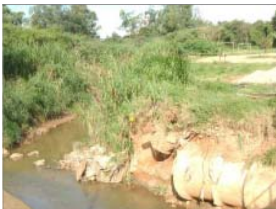
No Jardim Capivari, ponte desaparece após chuva

A Prefeitura de Campinas entregou, na terça-feira, o relatório com as pontes que foram danificadas pela chuva do dia 17 de fevereiro ao Governo do Estado. O