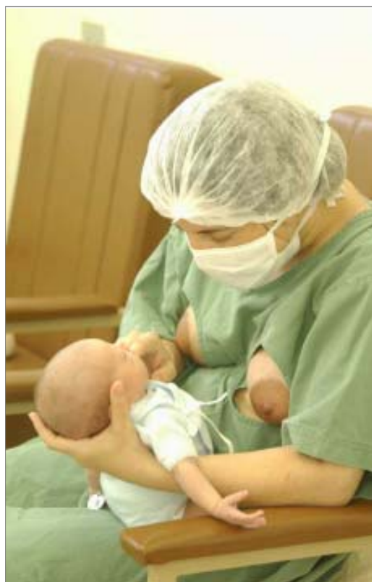
Criança é atendida no Banco de Leite Humano

Uma grande festa hoje, a partir das 10h30, marca o décimo aniversário do Centro de Lactação - Banco de Leite Humano Municipal de