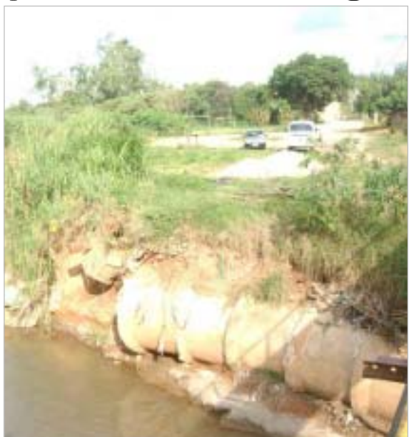
Ponte do Jardim Capivari destruída pelas chuvas

A Secretaria de Serviços Públicos entregou anteontem ao Governo do Estado o relatório indicando quais pontes da cidade foram danificadas pela chuva do dia 17 de fevereiro.