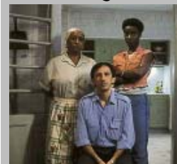
Cena de Domésticas

O filme Domésticas , dos diretores Fernando Meireles e Nando Olival, é a atração de hoje, às 19 horas, na Praça Bento Quirino, dentro do Projeto Cinema na Praça, realizado pela Setec. Durante todo dia, o local abriga uma grande feira de artes e artesanatos.