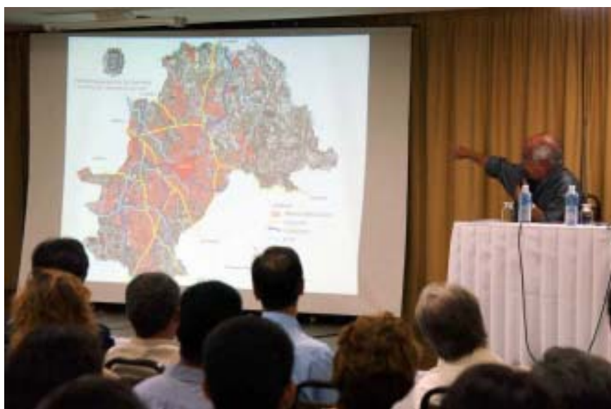
Apresentação do Plano Executivo de Desenvolvimento ontem, no Hotel Nacional Inn