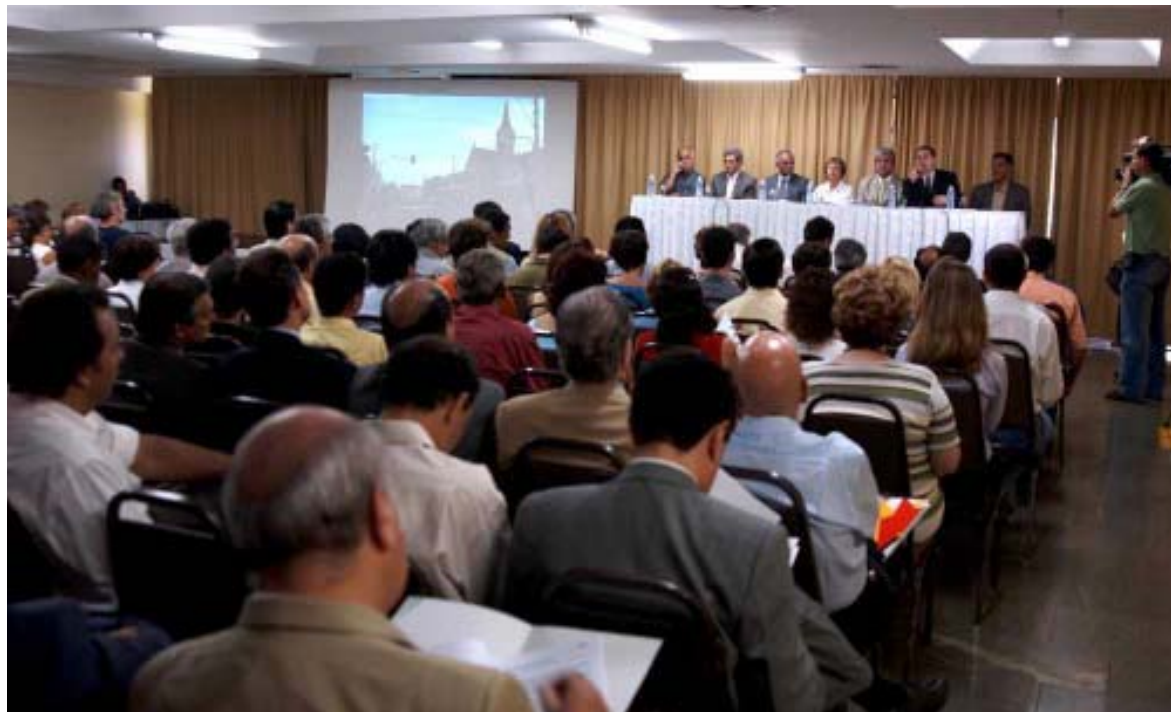
Lançamento do plano de desenvolvimento reuniu representantes da sociedade, empresários e políticos