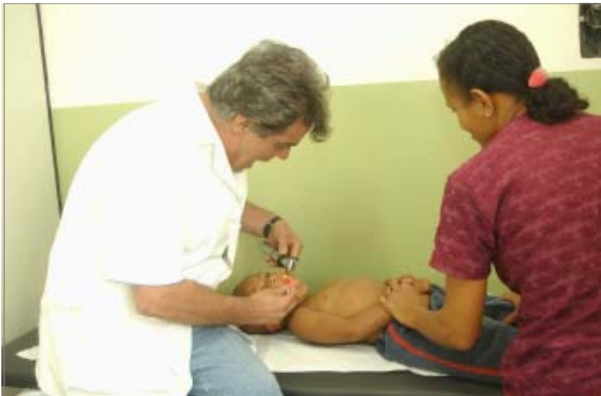
Pediatra presta atendimento na nova unidade, que já está funcionando

A Unidade de Saúde da Família do Jardim Monte Cristo será inaugurada às 9 horas do próximo domingo. O novo equipamento foi viabilizado com a parceria da população e custou R$ 14.969,38 aos cofres públicos.