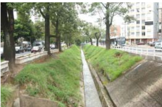
Serviço no canal é executado nos finais de semana

Cerca de 242 toneladas de lixo, pedras e pedaços de muretas de concreto já foram retiradas do canal da Avenida Orosimbo Maia.