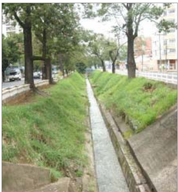
Córrego: entulhos prejudicam a vazão da água

A Secretaria Municipal de Serviços Públicos já retirou aproximadamente 242 toneladas de lixo, pedras e pedaços de muretas de concreto do canal do córrego Serafim, na Avenida Orosimbo Maia.