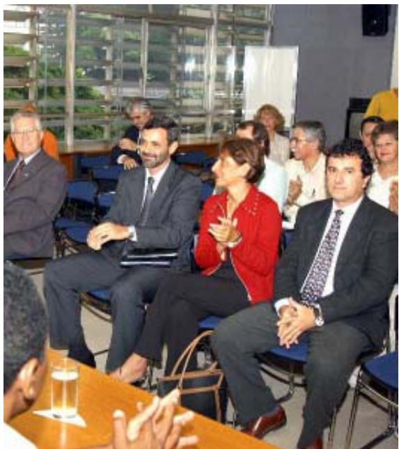
A função do Conselho é colaborar com a ouvidoria

A população de Campinas acaba de ganhar mais um canal de comunicação com a Administração Municipal. Tomaram posse ontem os seis membros do Conselho Consultivo da Ouvidoria Geral do Município.