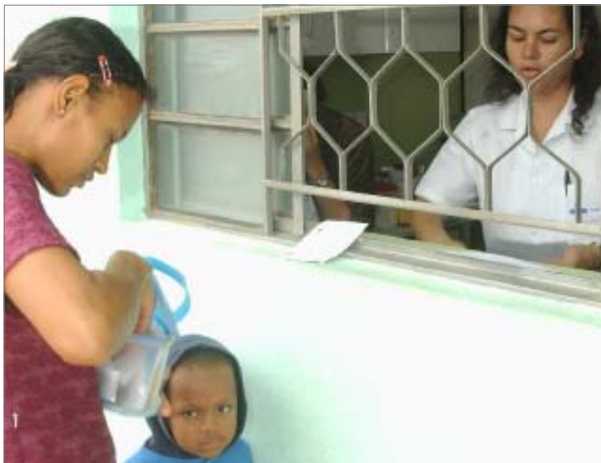
Unidade funciona como um Centro de Saúde pequeno com uma equipe do Paidéia

prevenção de câncer de colo de útero, atendimento médico e de enfermagem, além de aplicação de vacinas e de outros medicamentos injetáveis.