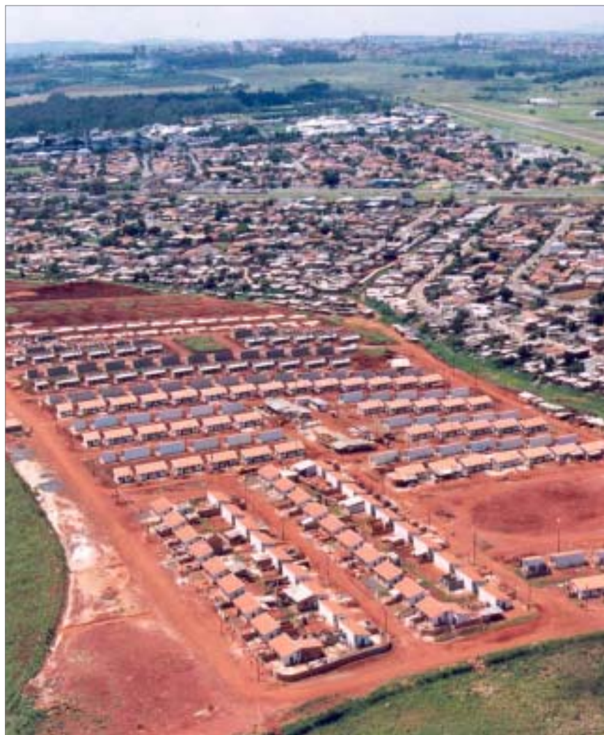
O contrato vai beneficiar cento e onze famílias que moram em áreas de risco

A assinatura do contrato será às 15 horas, na Escola Estadual Professora Castinauta de Barros Mello e Albuquerque, na Rua Orlando de Oliveira s/nº, no Jardim Campineiro.