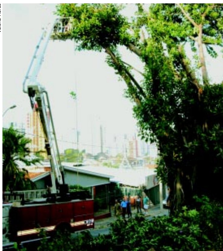
Área foi isolada para técnicos realizarem a derrubada