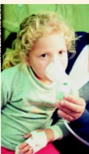
Criança é atendida no Mário Gatti