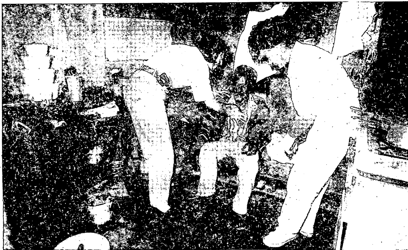
Os módulos de atendimento terão equipes de médicos, enfermeiros e auxiliares

Secretaria de Saúde tem tantas dificuldades para fixar médicos que nem mesmo as propostas de diferencial de salário para os profissionais e capacitação nas universidades foram suficientes, até agora, para estimular novas contratações.