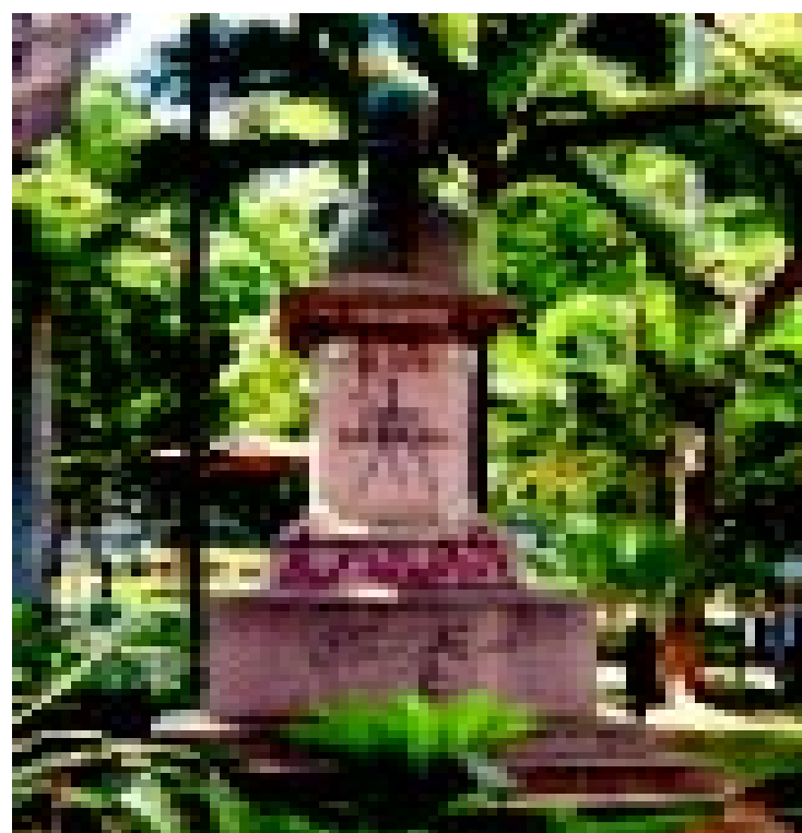
Monumentos recebem polimento e limpeza (alto e acima). Ao lado, bustos pixados que serão recuperados