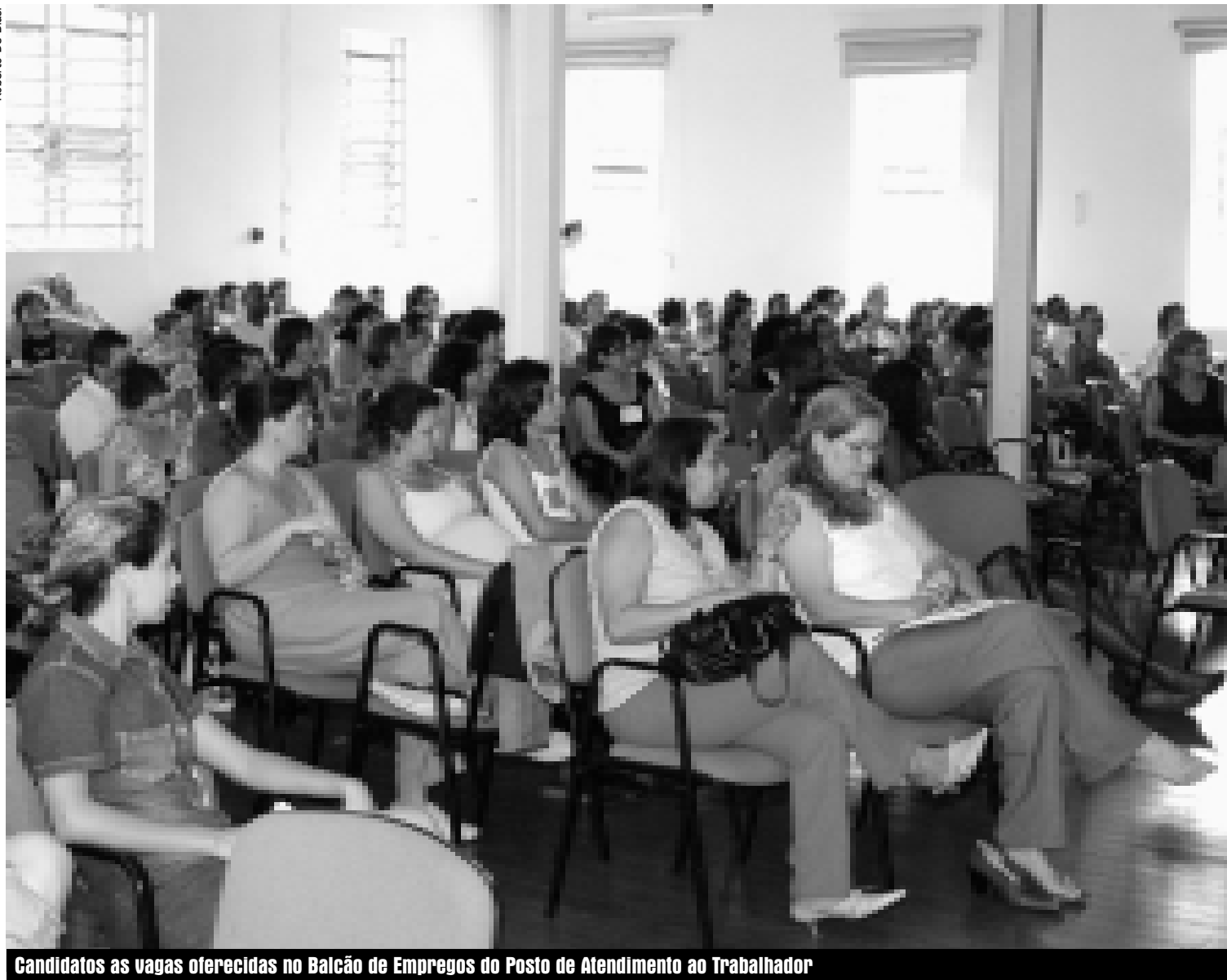
Candidatos as vagas oferecidas no Balcão de Empregos do Posto de Atendimento ao Trabalhador

pelo PAT para preencher o cadastro a procura de um trabalho. Em outubro, tiveram no Balcão de Empregos 1.160 pessoas, o que representa um crescimento de 5% pelo serviço.