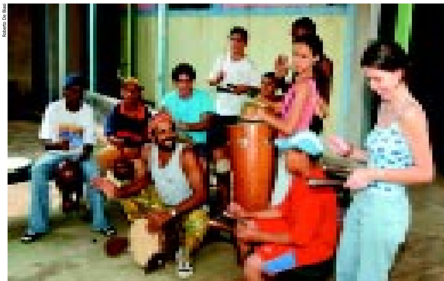
Instrutor e alunos do grupo de percussão da Escola Estadual 31 de Março: apresentação ao público na festa de formatura

As atividades, realizadas toda terça-feira, das 13h às 15h, fazem parte do projeto de ação comunitária, desenvolvido há três meses no Jardim Santa Mônica.