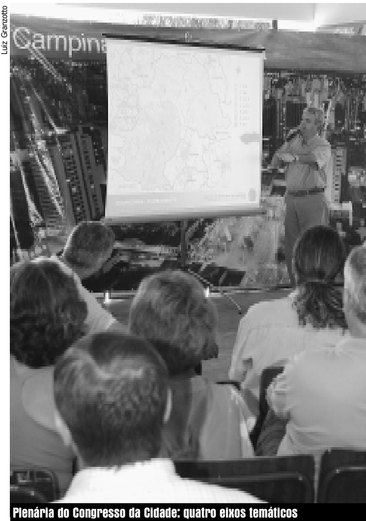
Plenária do Congresso da Cidade: quatro eixos temáticos

"A idéia é que os coordenadores de cada um desses eixos temáticos possam elaborar uma síntese