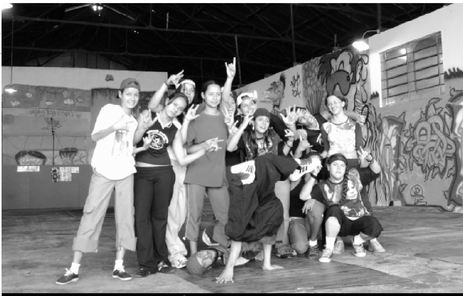
Grupo na Casa do Hip Hop: exemplo do resgate do patrimônio da cultura negra em Campinas