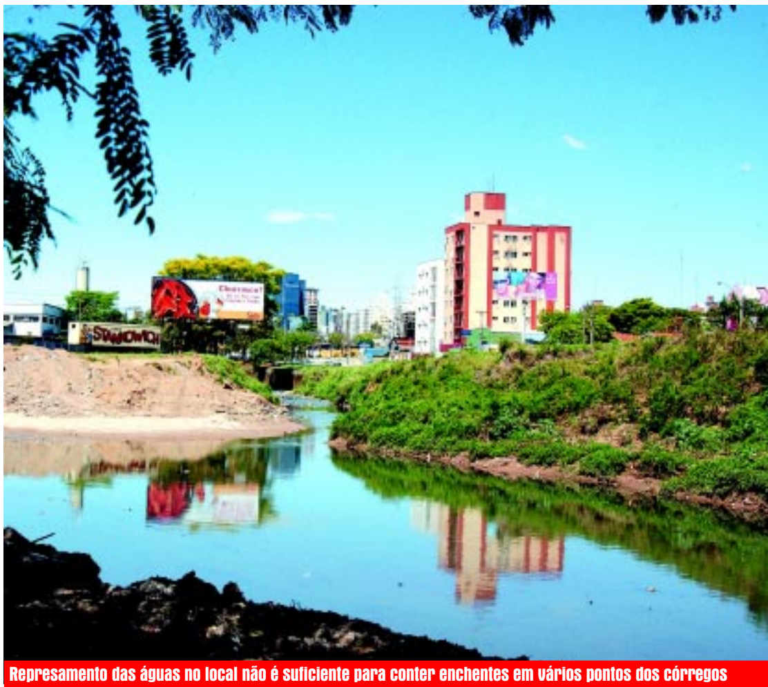
Represamento das águas no local não é suficiente para conter enchentes em vários pontos dos córregos

arborização, com o plantio de várias mudas de árvores e plantas ornamentais.