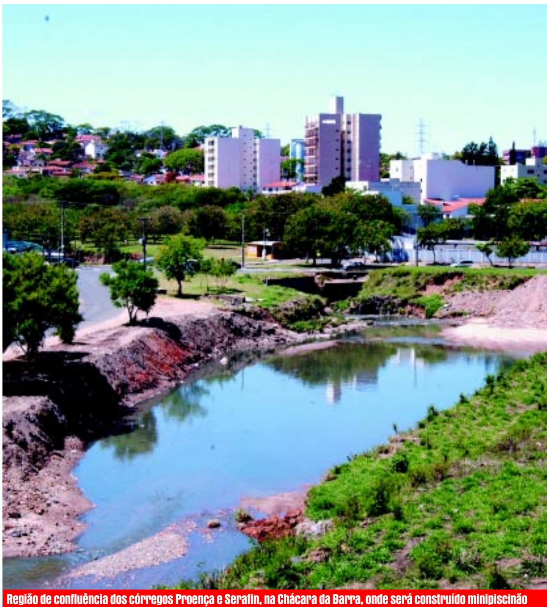
Região de confluência dos córregos Proença e Serafim, na Chácara da Barra, onde será construído minipiscinão