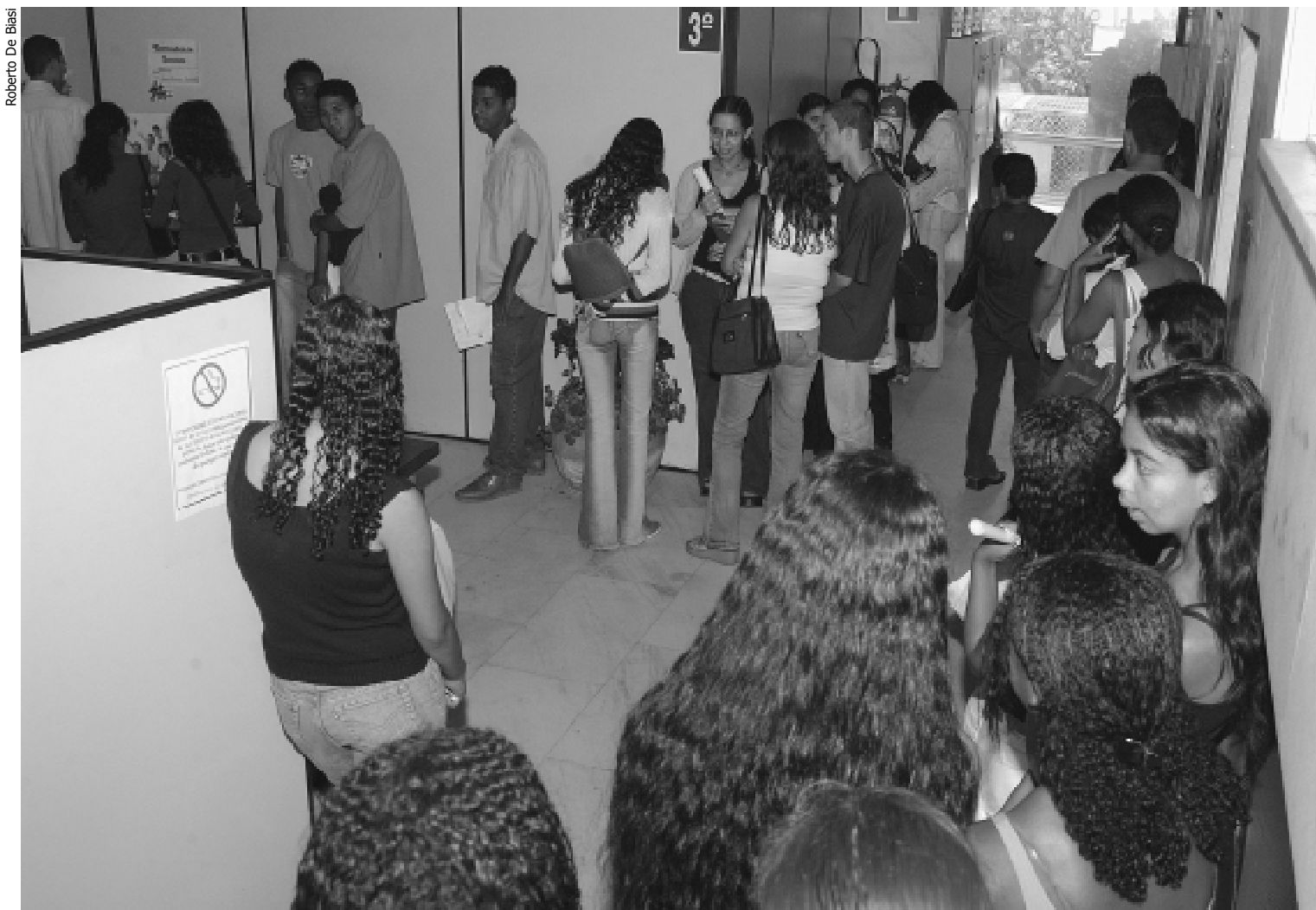
Jovens selecionados para participar do programa Primeiro Emprego se inscrevem na Prefeitura

se inscreveram no programa. Os aprovados vão trabalhar como agentes comunitários três dias por semana com jornada de quatro horas e, durante o programa, podem fazer cursos e oficinas.