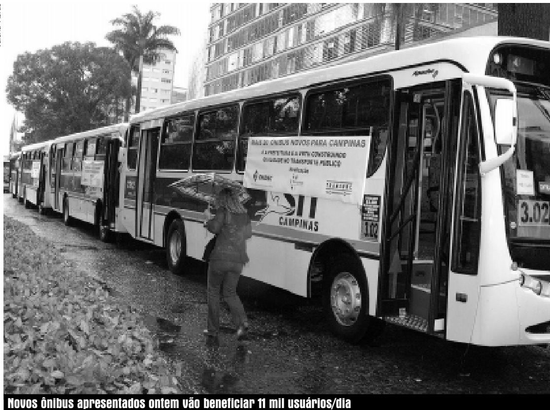
Novos ônibus apresentados ontem vão beneficiar 11 mil usuários/dia

novos, a Empresa Municipal de Desenvolvimento de Campinas (Emdec) informou que iniciará, a partir de hoje, o processo de mudança no embarque de passageiros no transporte coletivo. Com a mudança, que deverá estar concluída em fevereiro de 2004, os passageiros passarão a entrar pela porta da frente. A alteração no embarque vai garantir mais segurança aos usuários. Com estes 20 novos veículos, a frota de Campinas passa a somar 403 ônibus novos só nesta gestão. Hoje, a frota total é de Campinas é de 836 veículos. Os 20 novos veículos foram comprados pela empresa VBTU.