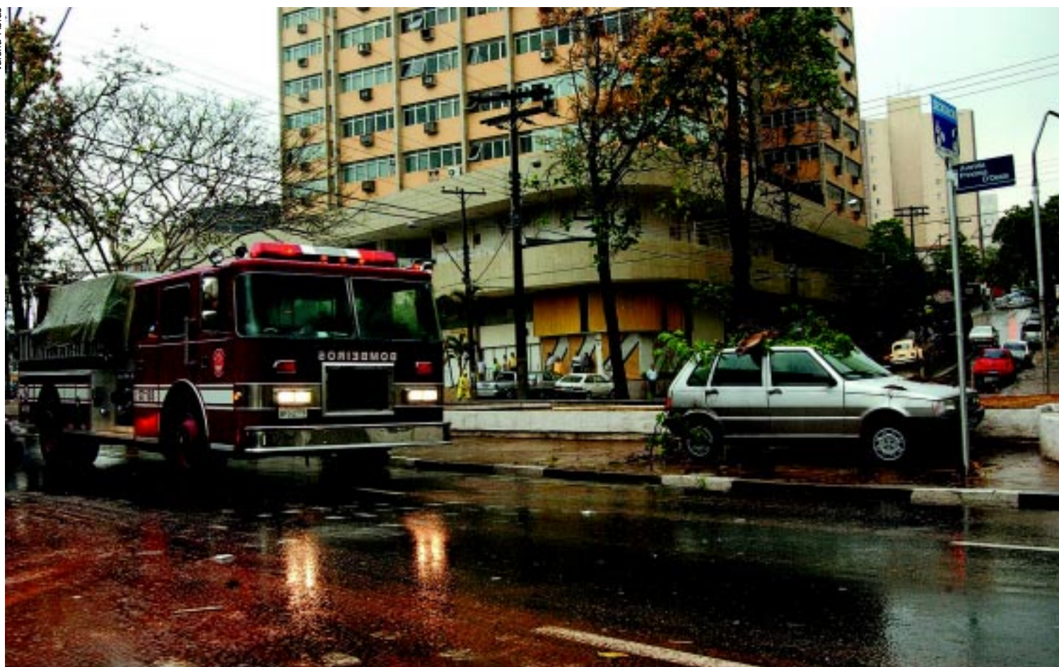
Equipes das Defesas Civis participaram ontem de simulação de inundação na avenida Princesa D'Oeste

to de inundação de vias públicas públicas, ontem em trecho da avenida Princesa D'Oeste, ocorreu em uma situação bem próxima da realidade.