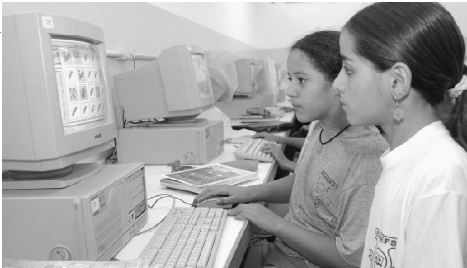
Número de escolas municipais ligadas à internet chegará a 37 até o final do ano

boratórios de informática, utilizando o sistema operacional Linux, de software livre. Com estes novos investimentos do Governo Federal, o número de escolas municipais ligadas à internet passará a 37. Para este ano, ainda está prevista a compra de mil computadores novos, que serão adquiridos por licitação já em andamento.