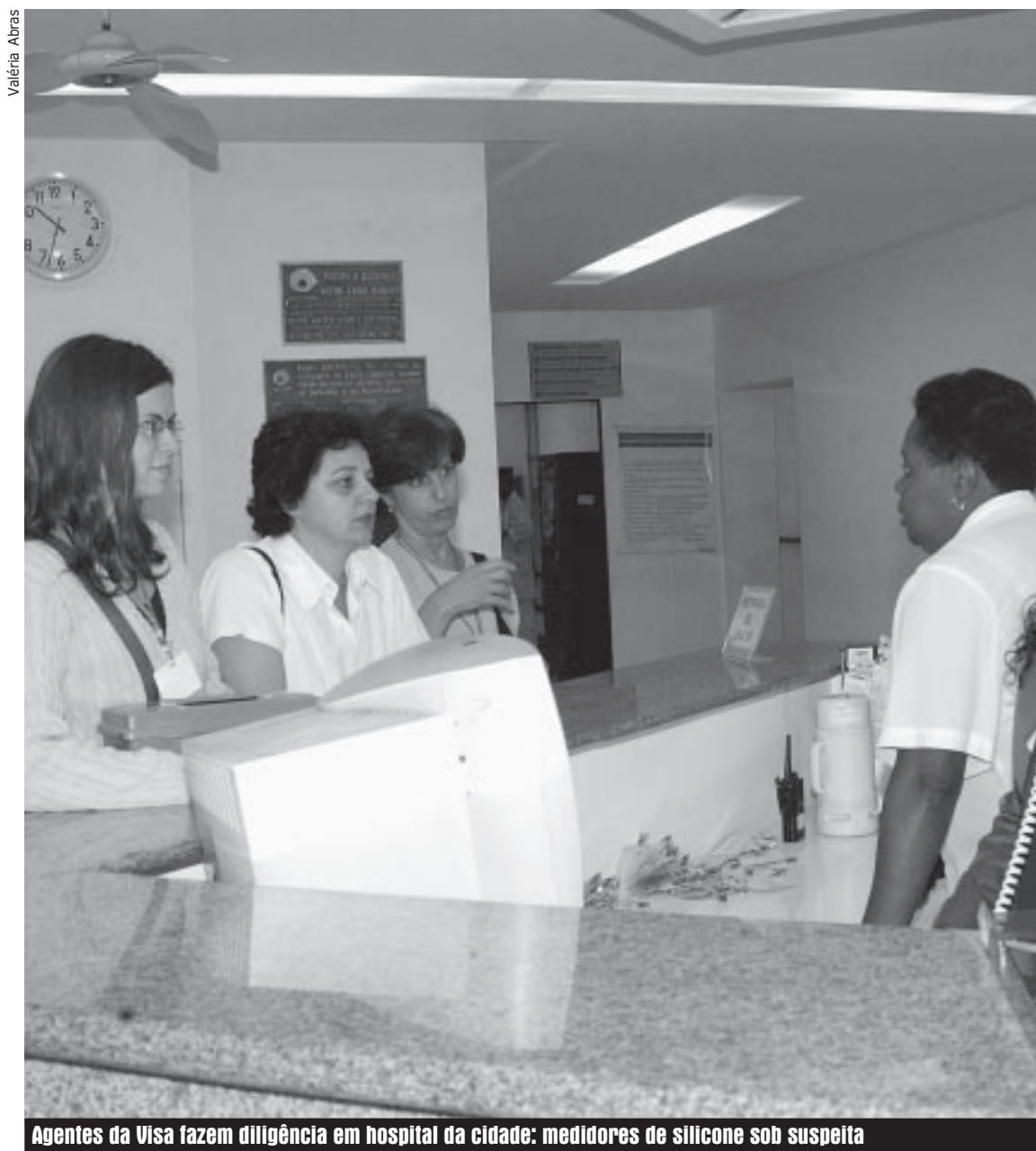
Agentes da Visa fazem diligência em hospital da cidade: medidores de silicone sob suspeita

Na semana passada, medida da Vigilância Sanitária Estadual proibiu o uso e a