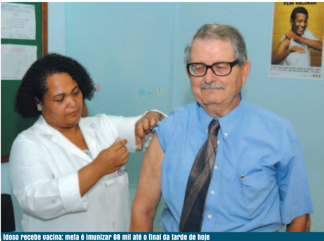
Idoso recebe vacina: meta é imunizar 68 mil até o final da tarde de hoje