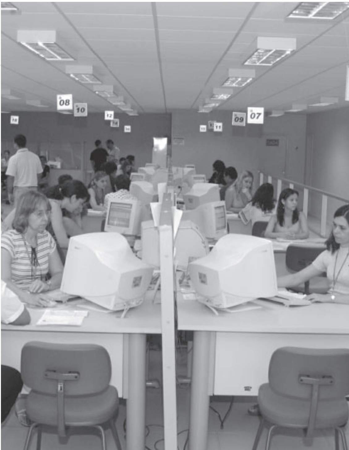
O Porta Aberta (antigo Guichê 3), no Paço Municipal: sistema melhora também o atendimento direto ao cidadão