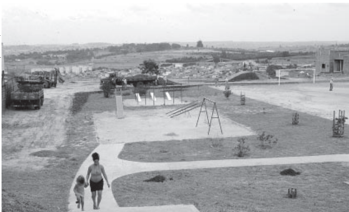
Praça no Parque Tropical, inaugurada em março: dez mil metros quadrados com equipamentos de lazer