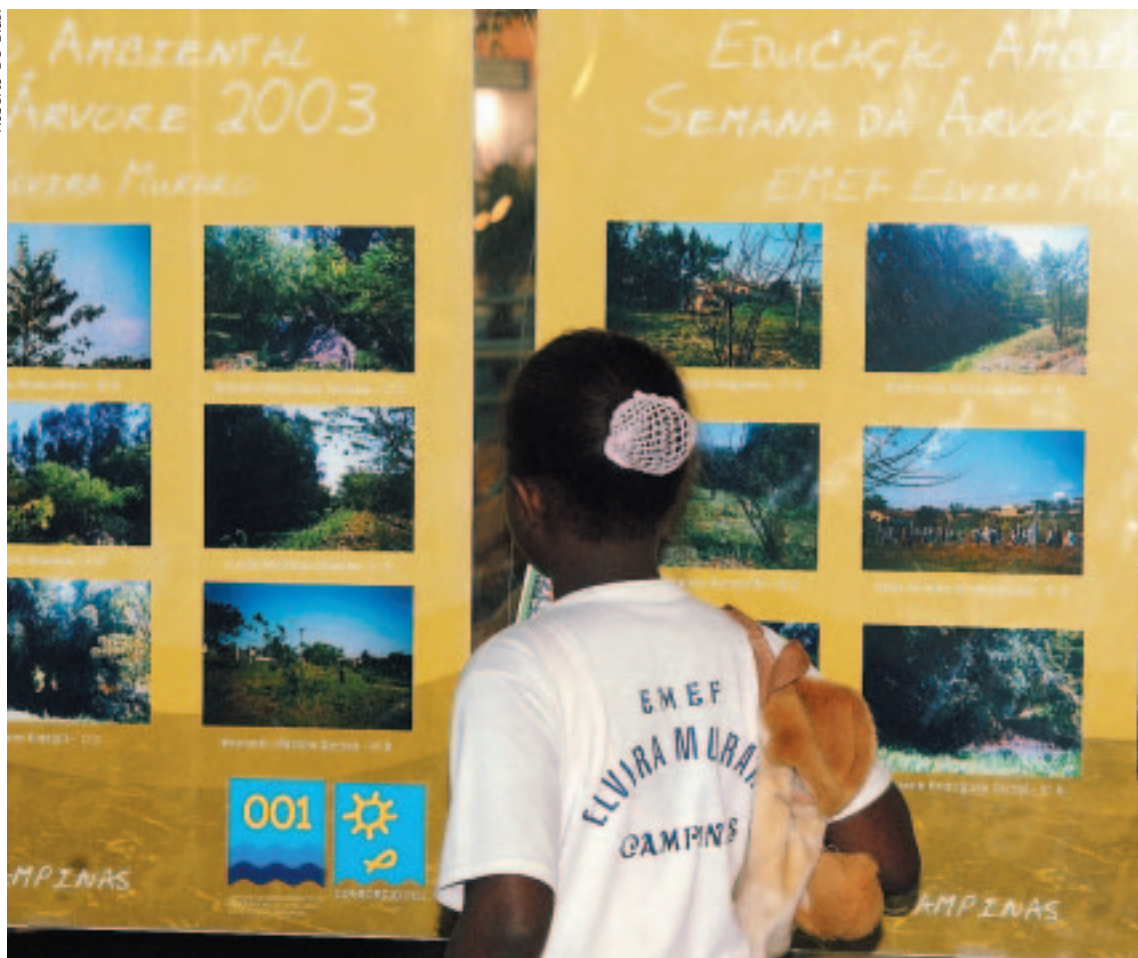
Aluna da Emef Elvira Muraro vê exposição no shopping: "Se todos fizerem um pouquinho, o mundo não será tão poluído"

O trabalho começou com o plantio de 500 mudas de árvores e limpeza das margens do córrego, em 2001. A partir daí, o projeto evoluiu para a conscientização da população local e o acompanhamento sistemático do crescimento das mudas plantadas, entre outras ações.