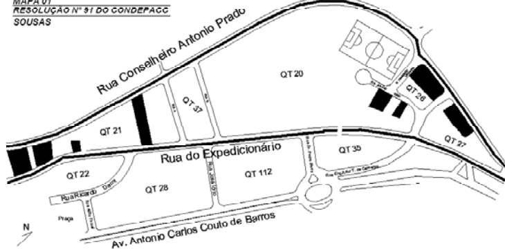
(25, 26, 27/11) MAPA 01 - RESOLUÇÃO Nº 91 DO CONDEPACC SOUSAS

RESOLUÇÃO Nº 91 de 2009 do CONDEPACC - "TRAÇADOS E CAMINHOS HISTÓRICOS E REMANESCENTES EM SOUSAS E JOAQUIM EGÍDIO" — TRAÇADOS TOMBADOS - Rua Conselheiro Antonio Prado e Rua do Expedicionário em Sosas ■ IMÓVEIS TOMBADOS - Rua Antonio Iório nºs 37; 71; 81; 91 no Quarteirão 20 / Rua Conselheiro Antonio Prado nºs 243-245; 251-257; 271; 279 no Quarteirão 27 / Rua Conselheiro Antonio Prado nºs 321; 329; 341; 351; 361; 381 no Quarteirão 26 / Rua do Expedicionário nºs 570; 596; 656; 714 no Quarteirão 21.