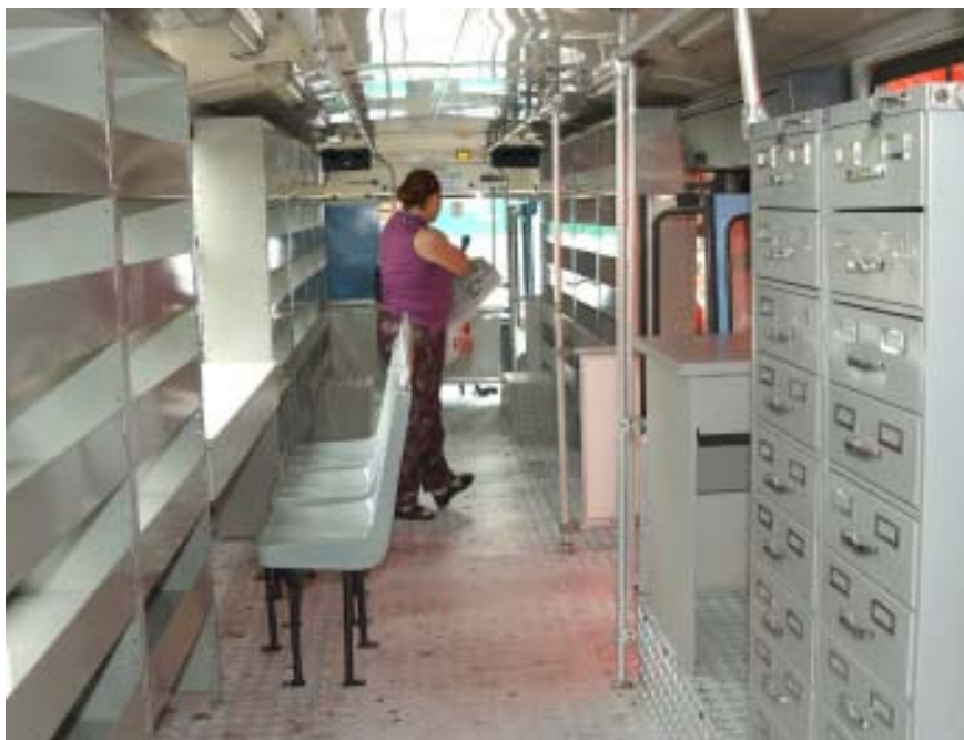
Quinzenalmente, cada ônibus levará uma biblioteca aos bairros visitados