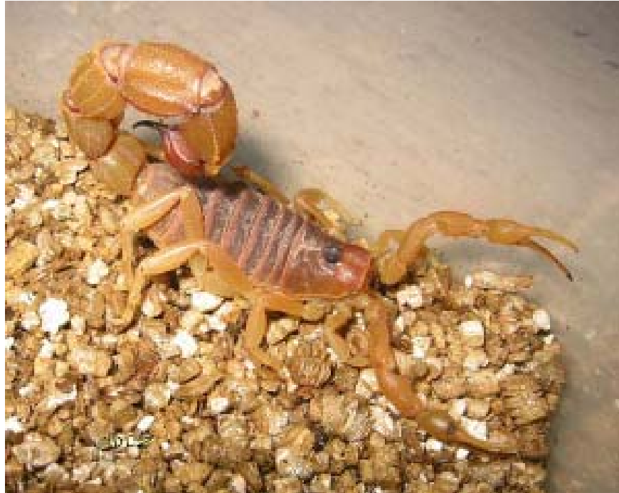
Escorpião amarelo: espécies se adaptaram aos esgotos, por onde entram nas casas

A ocorrência se explica pelas condições favoráveis do lugar, constituído por solo arenoso e úmido. Segundo Cláudio Castagna, médico veterinário