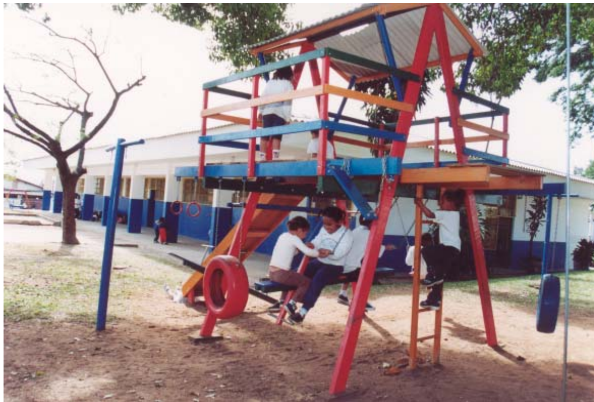
Crianças brincam em escola municipal: este ano devem abrir 2,7 mil novas vagas totalizando 27.801 alunos

Os números finais do cadastro da educação infantil apontaram uma demanda de 18.836 crianças sem atendimento. Além das vagas na rede municipal a Secretaria está finalizando as parcerias com as entidades que recebem repasses para atender crianças de 4 a 6 anos e portadores de necessidades especiais. Nestas parcerias houve um aumento de vagas que serão disponibilizadas