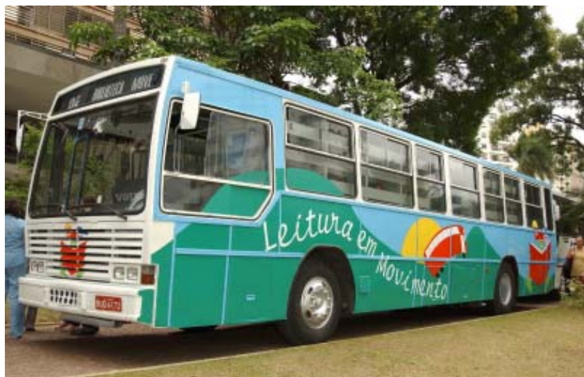
Ônibus-biblioteca levará a leitura para bairros periféricos de Campinas

Foram entregues ontem dois ônibus da Transurc que serão usados no projeto Leitura em Movimento. Esses veículos circularão pelos bairros periféricos de Campinas com um acervo de três mil livros em cada um. Financiado pela Fundação de Amparo à Pesquisa do Estado de São Paulo (Fapesp), o projeto é uma parceria entre a Prefeitura e a Faculdade de Biblioteconomia da PUC-Campinas.