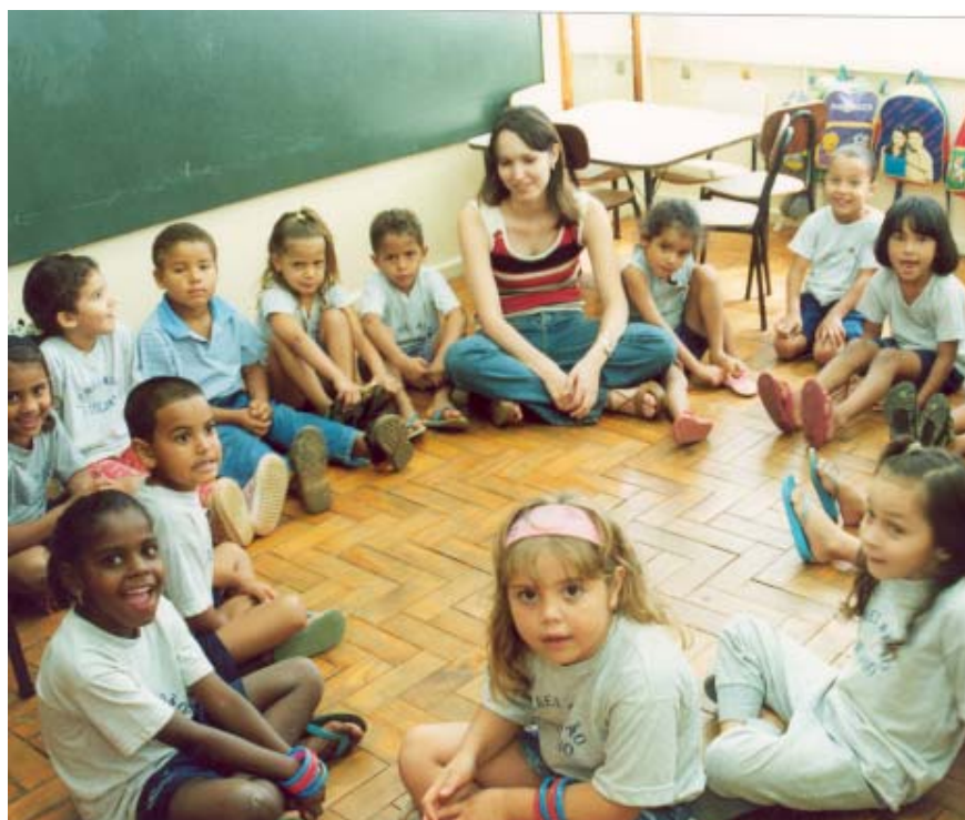
Crianças em unidade de educação infantil: seleção conforme critérios sociais